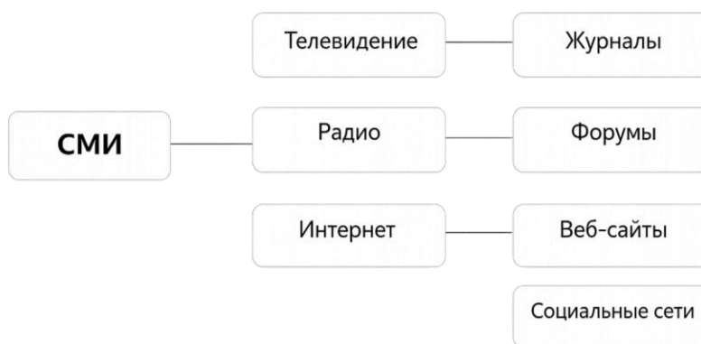
Рис. 1. Виды СМИ

В структуру средств массовой информации входят печатные издания, радио, телевидение и кинематограф. Основная роль СМИ заключается в обеспечении общества информационными, образовательными и развлекательными ресурсами. Средства массовой информации оказывают существенное влияние на социальные трансформации и формирование гражданской ответственности.