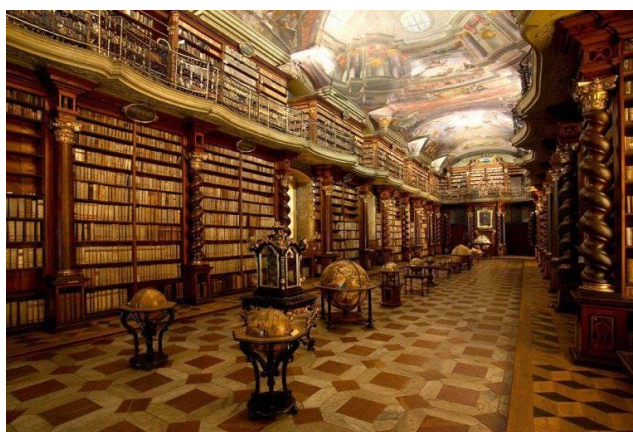
4- rasm. Praga Milliy Kutubxonasi

Baland ustunlar, o'ymakorlik va detallarga boy bezaklar masalan ustunlar ishlatilgan.