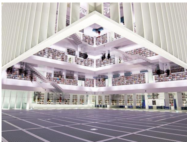
3- rasm. Shtutgardagi Shtutgart shahar kutubxonasi