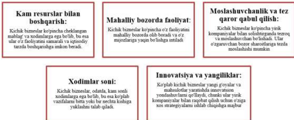
2-chizma. Kichik biznesning asosiy xususiyatlari

Kichik biznes - bu nisbatan kam resurslar va kichik hajmdagi faoliyatni olib boradigan korxonalaridir. Bunday bizneslar odatda bir necha xodimga ega bo‘ladi, ularning faoliyati ko‘proq mahalliy bo‘lib, o‘ziga xos mahsulotlar yoki xizmatlar taklif qiladi. Kichik bizneslar iqtisodiyotda muhim rol o‘ynaydi, chunki ular ko‘plab ish o‘rinlarini yaratadi, mahalliy bozorlarni qo‘llab-quvvatlaydi va yangiliklar va innovatsiyalarni olib kelishi mumkin. Kichik biznesning asosiy xususiyatlari 2-chizmada ko‘rsatilgan.